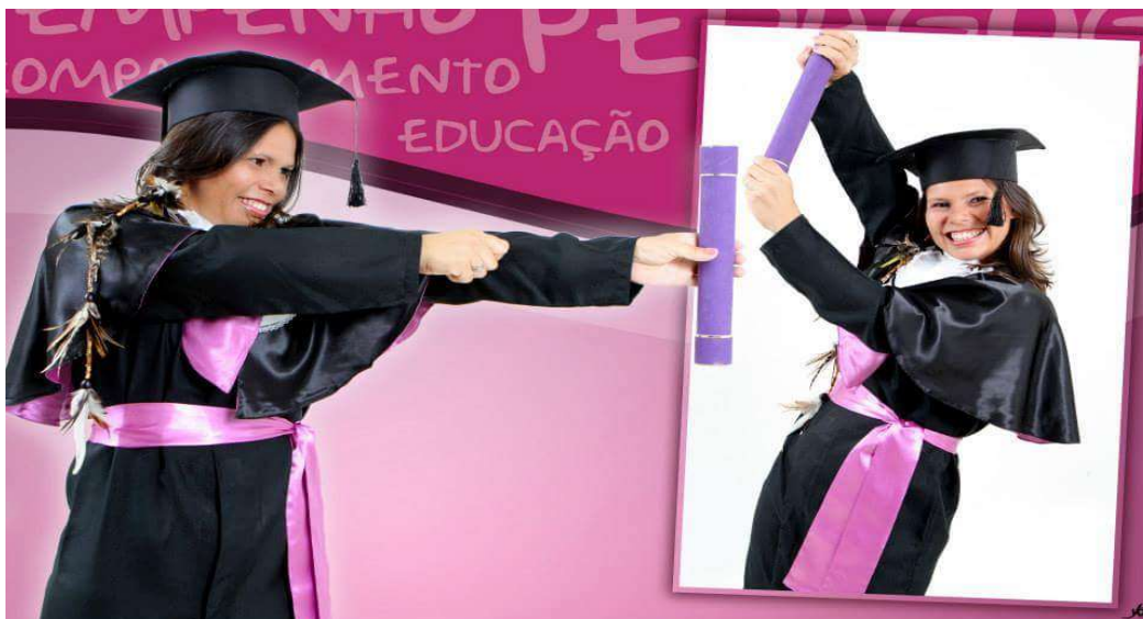
Figura 02: Momento em que recebi o diploma de Pedagogia.

Então, com o apoio da comunidade, mudei-me para a aldeia, fiz o processo seletivo municipal, passando a trabalhar na Escola Indígena Pataxó Mata Medonha (EIPMM) como professora de Língua Portuguesa e de Ciências, participando ativamente, dos Fóruns de Educação Escolar Indígena e de outras manifestações. No final de 2012 concluí o curso de Pedagogia.