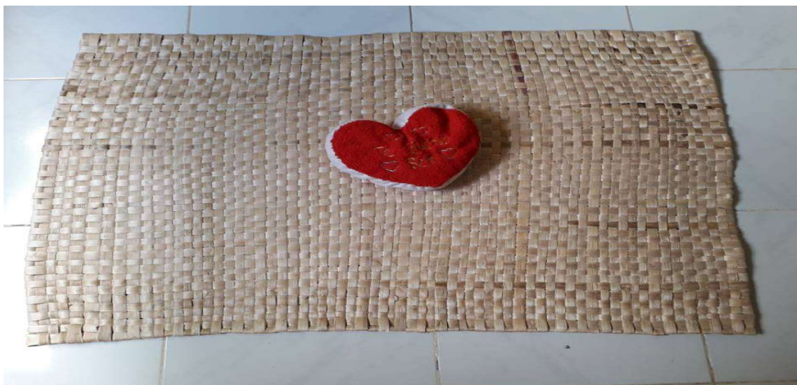
Figura 34 Tapete tecido com fibra de bananeira