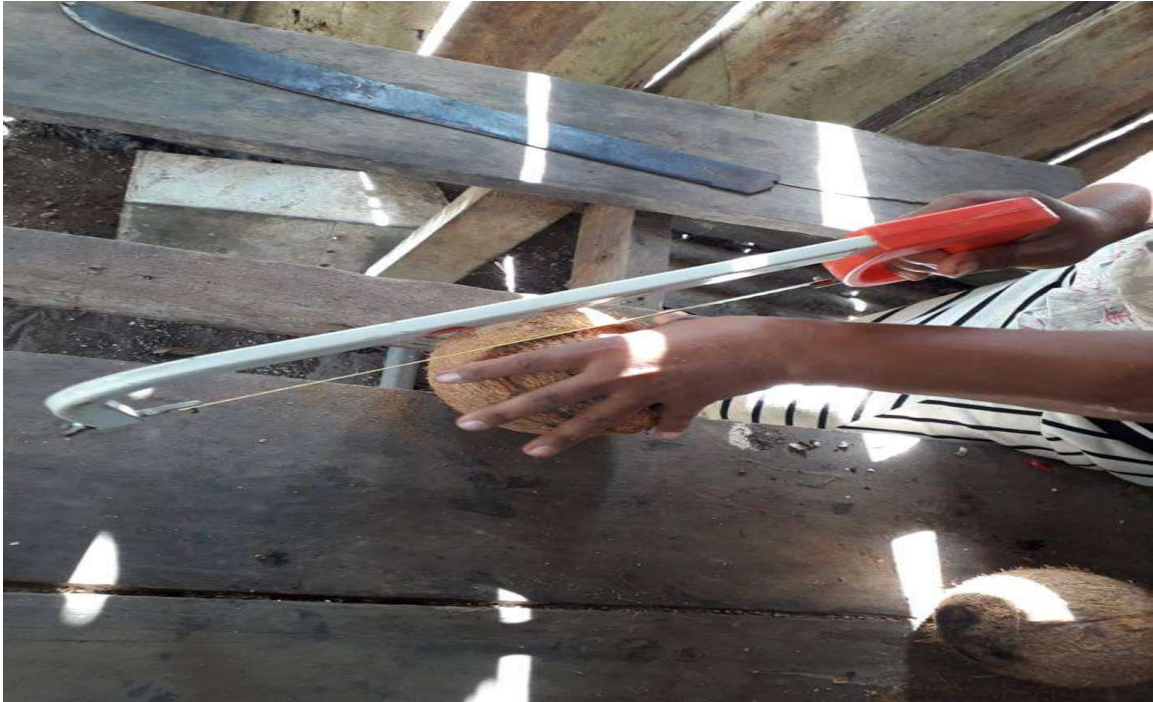
Figura 23 preparação do coco para o artesanato.

Após abrir o coco, retira-se a polpa, que será usada para doces ou para a confecção de óleo, e em seguida começa o trabalho no motor, o que a artesã faz com muita agilidade e criatividade.