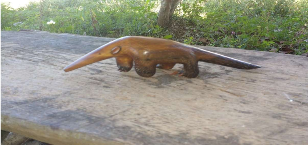
Figura 48:Tamanduá, feito com louro-casca-preta.