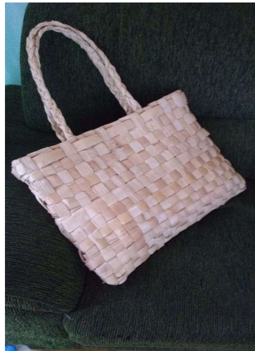
Figura 32 e 33: foto Tamikuã Pataxó, bolsas tecidas com fibras de bananeira,