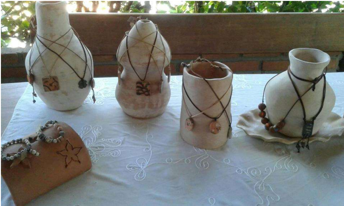
Figura 37 vasos e bio joias.

Eu, Tamikuã Pataxó, desde criança sempre gostei de fazer pequenas esculturas e utensílios de argila.