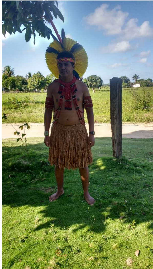
Figura 60, (kacusú usando tupsay)