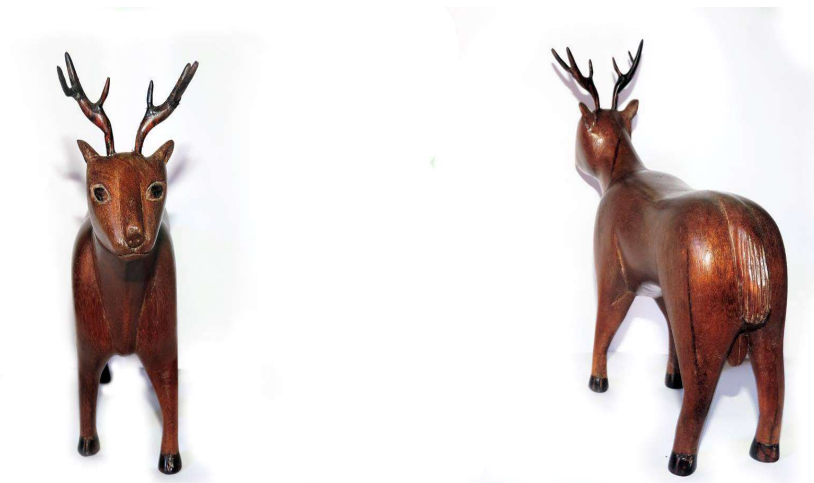
FIGURA 50: Veado (mãñy) feito de Louro-casca-preta.