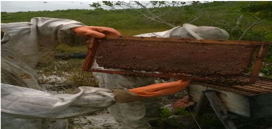
Figura 20 Apiário aberto para a extração do mel.

fazem parte da renda do casal, uma vez que, ao serem chamados para o serviço de captura em locais privados, residência ou pousadas, é cobrada uma taxa.