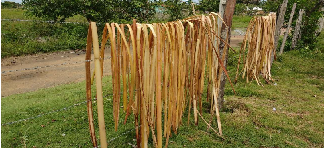
Figura 28 Foto Tamikuã Pataxó. Fibras em processo de secagem.

As fibras devem ser bem secas para um maior aproveitamento e para que possam ser armazenadas, já que no inverno não será possível fazer esse processo. O armazenamento deve ser feito em caixas de papelão e sempre que possível devem ser expostas ao sol, para evitar uma possível proliferação de fungos. A eliminação completa do aparecimento de fungos só ocorrerá depois que as peças prontas forem envernizadas. Além das fibras, também são utilizadas linhas de tucum, produzidas pela própria artesã, em processo completamente manual. Para fazer as linhas, ela emprega apenas um facão ou mesmo uma faca para a retirada das folhas da planta. Ainda são usadas algumas espécies de sementes e cola para artesanato, na decoração de algumas peças. Depois desse processo vem outro desafio, o tecer e a montagem das peças. Esse trabalho é feito com simplicidade e com muita dedicação. Como nos exemplos abaixo: