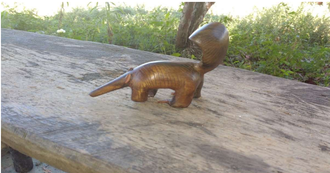
Figura 47: Tamanduá mirim, feito com louro-casca-preta.

As figuras 45 e 46 retrata o tamanduá bandeira feito de caixeta, a diferença na coloração de ambas as peças acontece no acabamento com uma mistura de cola araudite e álcool, a qual ele utiliza em todas as peças deixando-as impermeáveis.