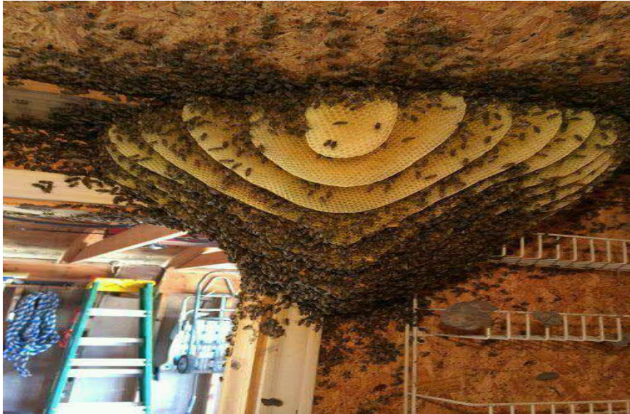
Figura 18 Enxame encontrado em uma pousada da região.