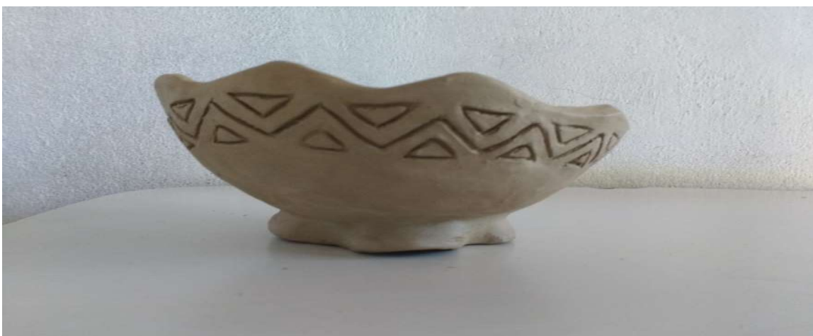
Figura 39 fruteira de argila.

Porém, nunca antes havia levado a sério o trabalho e por isso usava essa arte apenas como Passa-Tempo. Após essa participação na oficina, pude me identificar com a arte e