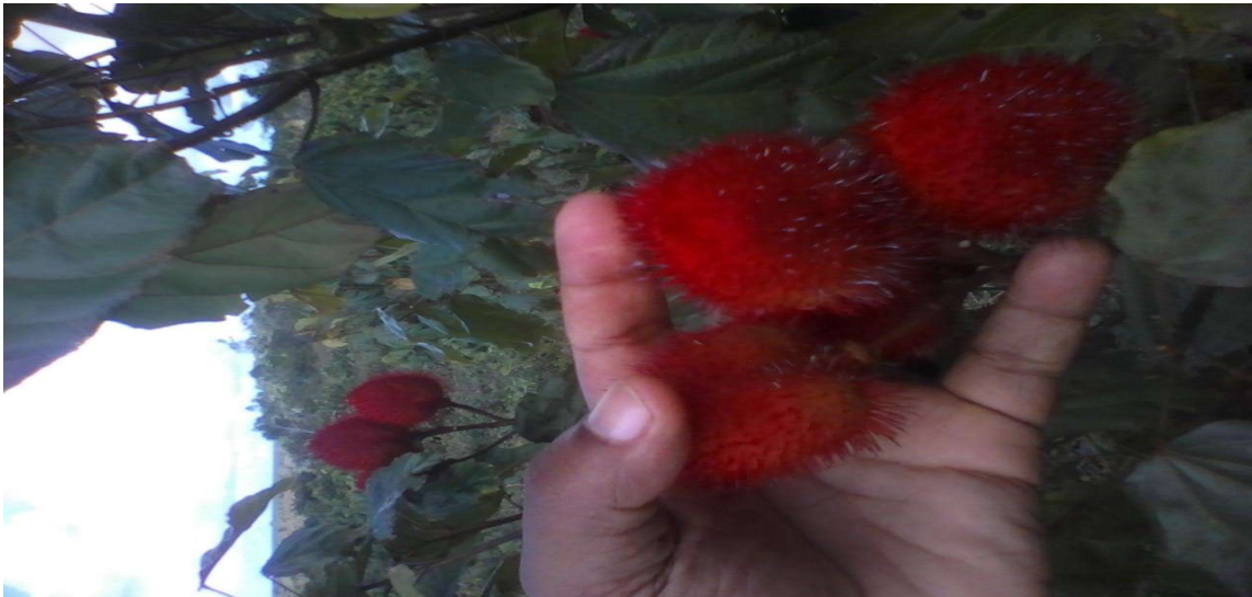
Figura 12 Fruto do urucum

fabricação de corante natural, além de ser muito utilizada na nossa cultura nas pinturas corporais.