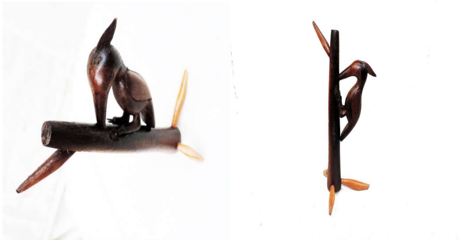
FIGURA 51: Pica-pau (jiktayá)feito com louro-casca-preta.