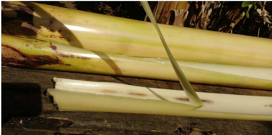
Figura 27 Retira-se as capas e corta em tiras na vertical com aproximadamente 3 a 4 centímetros de largura.

Após a colheita da banana, o tronco é recolhido e são retiradas as primeiras capas que serão deixadas no solo, ou reaproveitadas no manejo da horta como adubo. Ao aparecer a parte lisa, com a ajuda de uma faca, as próximas capas serão cortadas em tiras na vertical de aproximadamente 3 a 4 centímetros de largura e colocadas ao sol para secar. Esse processo depende muito do tempo, pois a secagem precisa de uns 4 dias de sol, enquanto se está secando também é feito o processo de amaciamento das fibras, o que é feito com a própria faca utilizando o lado oposto do corte, deslizando-a várias vezes nas tiras na vertical.