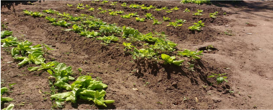
Figura 58 Canteiro de alface