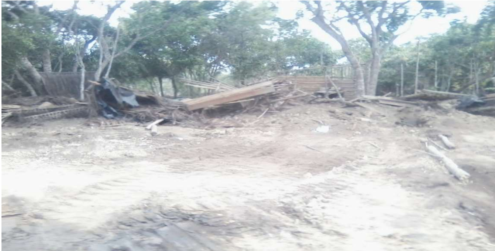
Figura 05 o que restou do meu kijeme (casa)

E diante das nossas crianças, chegaram com máquinas, jogando tudo no chão.