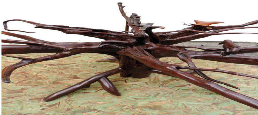
Figura 53: Mesa feita com raiz de mussutaiba

As peças das figuras 45, 46, 47, 48, 50, 51 e 52 apresentadas acima foram feitas a partir de sobras de madeira, refugos das serrarias, ou de carpintarias da região.