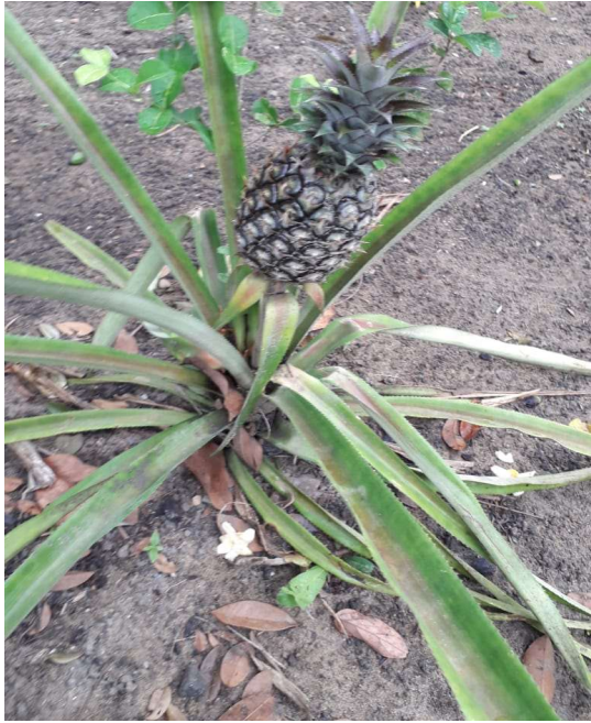
Figura 14 abacaxi