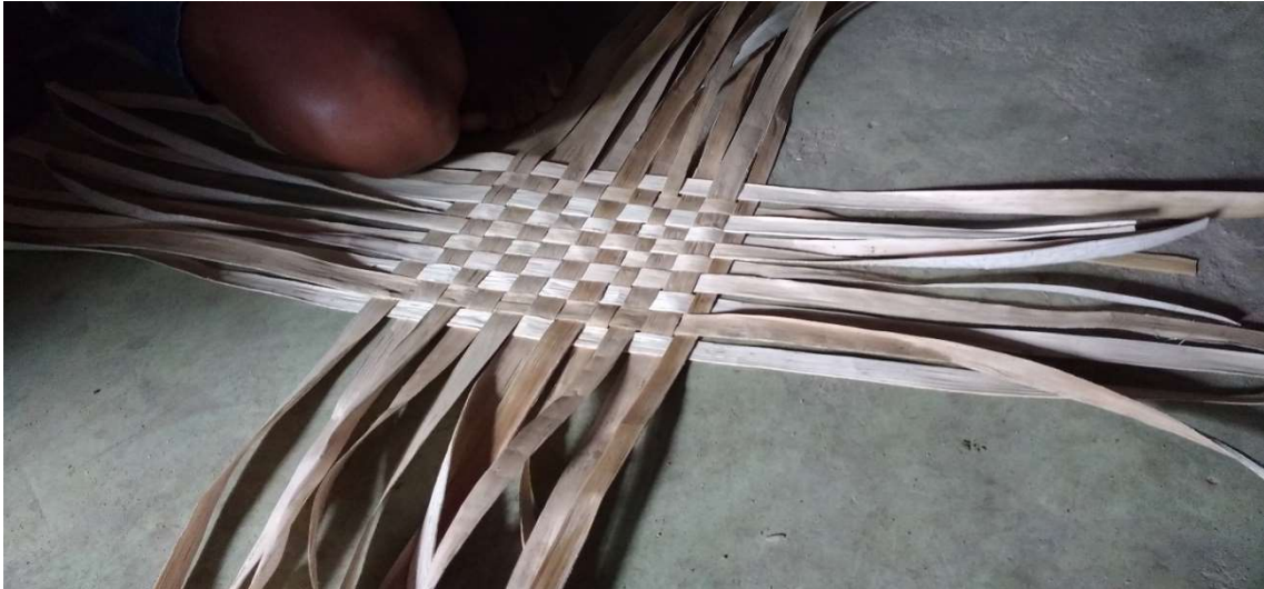
Figura 30 (Foto: Tamikuã Pataxó) utensílio já em fase de acabamentoFigura 31 (Foto: Tamikuã Pataxó) utensílio pronto para o uso.

O utensílio acima foi confeccionado exclusivamente com a fibra de bananeira. Foi utilizada como ferramenta apenas uma faca no momento da preparação das fibras, além das mãos e dos pés, conforme mostra a figura de nº 29. De maneira semelhante, são confeccionadas as demais peças a seguir: