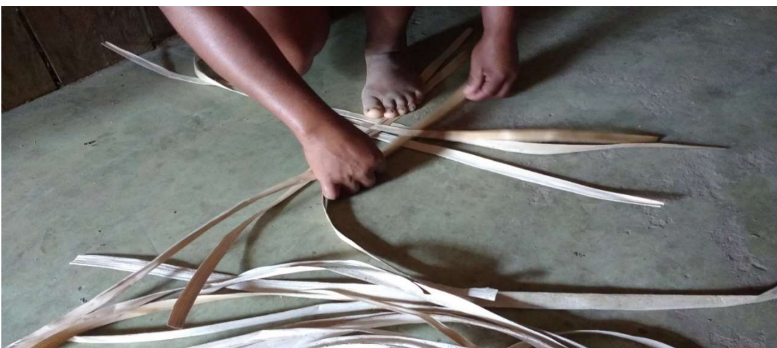
Figura 29 Início do processo de montagem de um descanso de panela, (utensílio de cozinha)

As fibras devem ser bem secas para um maior aproveitamento e para que possam ser armazenadas, já que no inverno não será possível fazer esse processo. O armazenamento deve ser feito em caixas de papelão e sempre que possível devem ser expostas ao sol, para evitar uma possível proliferação de fungos. A eliminação completa do aparecimento de fungos só ocorrerá depois que as peças prontas forem envernizadas. Além das fibras, também são utilizadas linhas de tucum, produzidas pela própria artesã, em processo completamente manual. Para fazer as linhas, ela emprega apenas um facão ou mesmo uma faca para a retirada das folhas da planta. Ainda são usadas algumas espécies de sementes e cola para artesanato, na decoração de algumas peças. Depois desse processo vem outro desafio, o tecer e a montagem das peças. Esse trabalho é feito com simplicidade e com muita dedicação. Como nos exemplos abaixo: