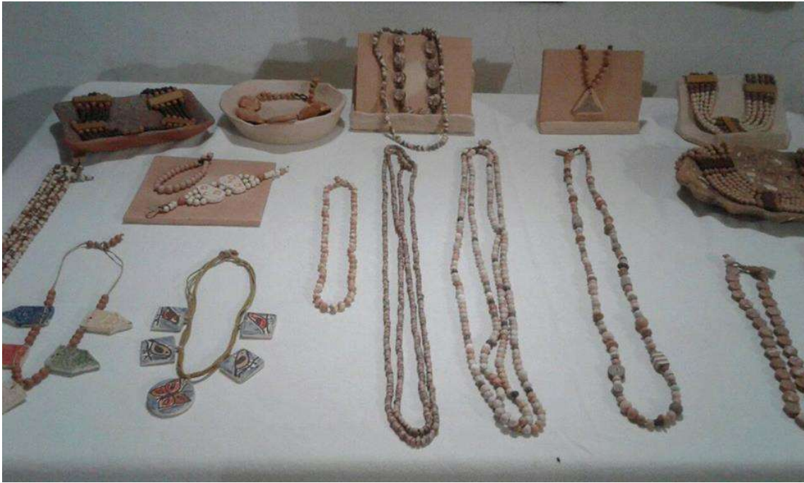
Figura 36 Joias da Terra