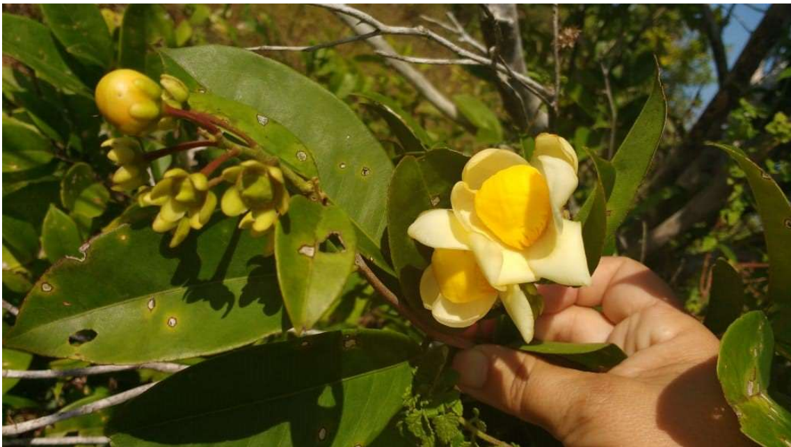
Figura 63 (txahá) flor e fruto da biriba