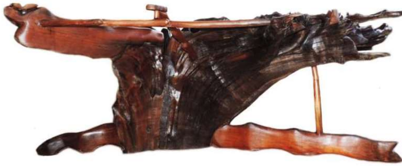
FIGURA 54: Mesa de raiz de louro casca preta.

Pés de mesas feitas com partes de troncos e de raízes de árvores encontradas em áreas desmatadas.