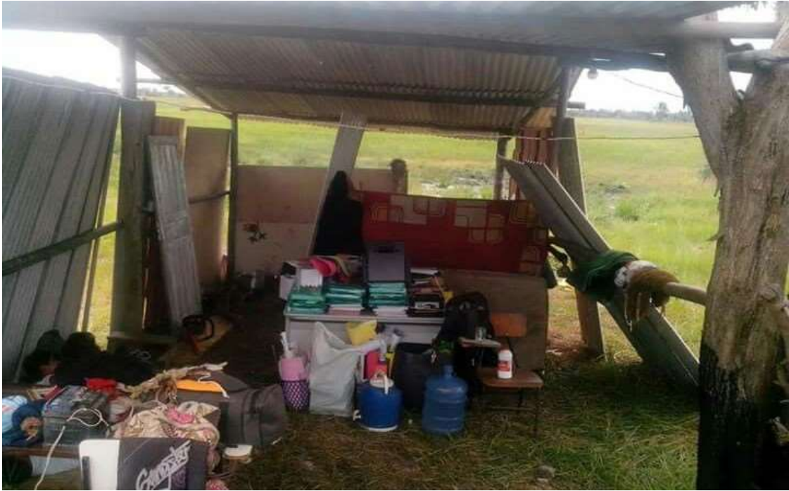
Figura 06 Escola improvisada no acampamento as margens da BA-001