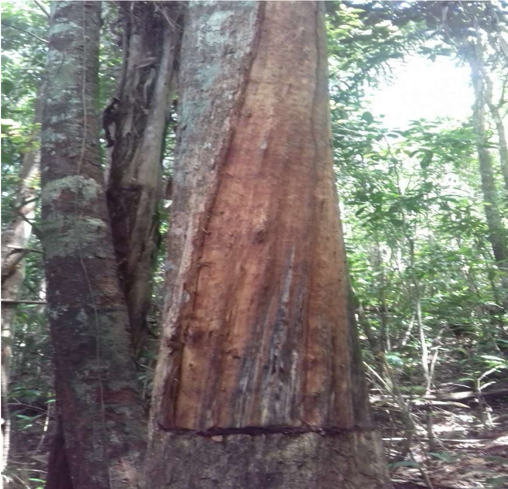
Figura 65 Árvore de biriba após retirada do pano (fibra)