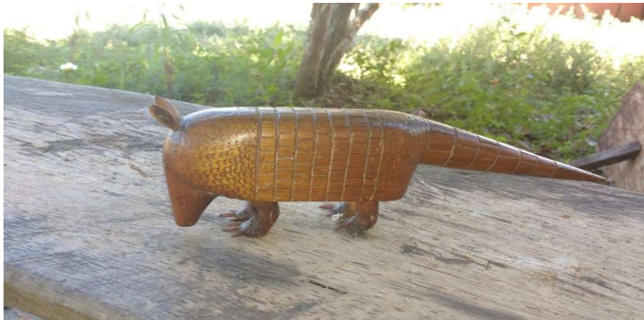
FIGURA 52: Tatu verdadeiro, (uhâi) feito com louro-casca-preta.

As peças das figuras 45, 46, 47, 48, 50, 51 e 52 apresentadas acima foram feitas a partir de sobras de madeira, refugos das serrarias, ou de carpintarias da região.