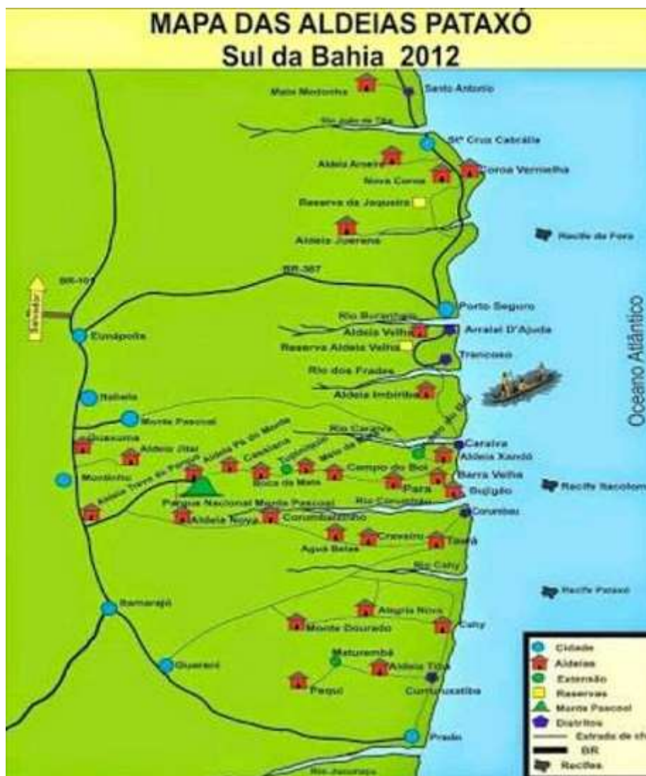
Figura 08. Mapa das aldeias Pataxó. 4

Com o intuito de contextualizar melhor esta pesquisa, apresento uma breve descrição sobre o povo Pataxó.