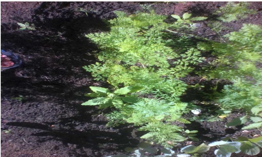
Figura 59 Canteiro de cenoura