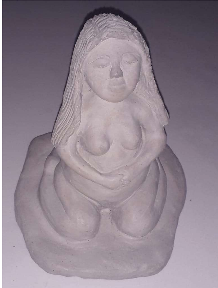
Figura 38 escultura de uma índia gestante