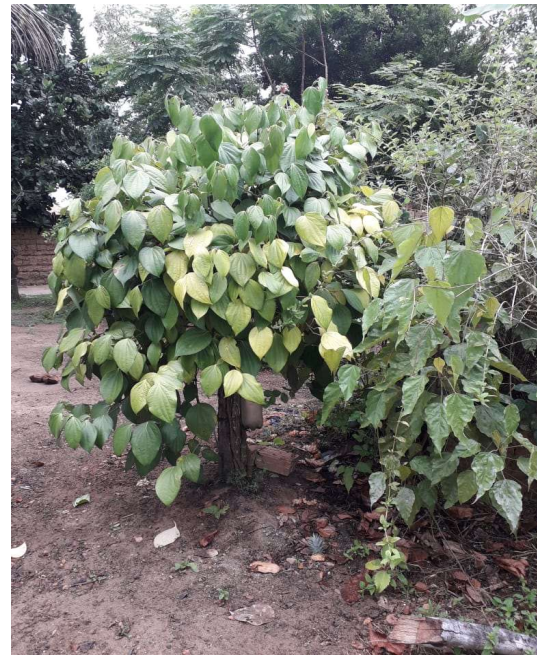
Figura 15 Tamikuã Pataxó pimenta do reino

Durante o período em que estivemos no roçado, falou-se muito da necessidade de se fazer um banco de sementes na comunidade, o que no momento só está em nossos planos futuros.