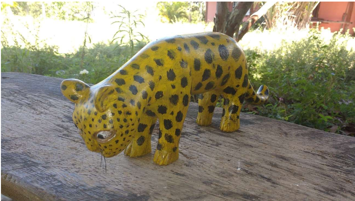
Figura 55 onça pintada (hamugãe) retratada em louro-casca-preta.

Pés de mesas feitas com partes de troncos e de raízes de árvores encontradas em áreas desmatadas.