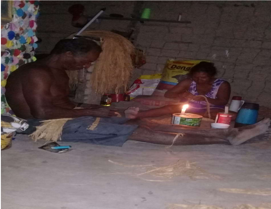
Figura 61 o casal preparando o material para tecer as peças.

O tupsay é uma espécie de roupa confeccionada a partir de fibras de árvores. Nossos ancestrais já utilizavam fibras de árvores para amarrar ou mesmo tecer redes, e também as vestimentas com essas fibras. Cada povo tem seu jeito específico. No caso dos Pataxó, as fibras são retiradas de uma árvore nativa das nossas matas, conhecida como biriba, a mesma é uma espécie de sapucaia.