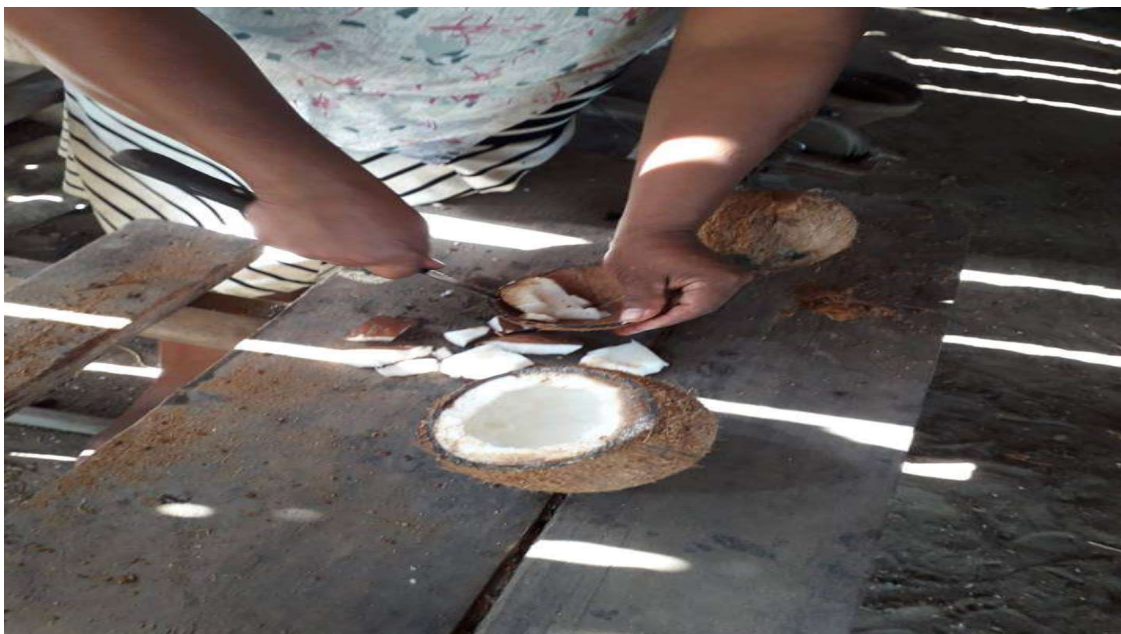
Figura 24 A artesã retira a massa que será usada para doces ou óleo.

Após abrir o coco, retira-se a polpa, que será usada para doces ou para a confecção de óleo, e em seguida começa o trabalho no motor, o que a artesã faz com muita agilidade e criatividade.