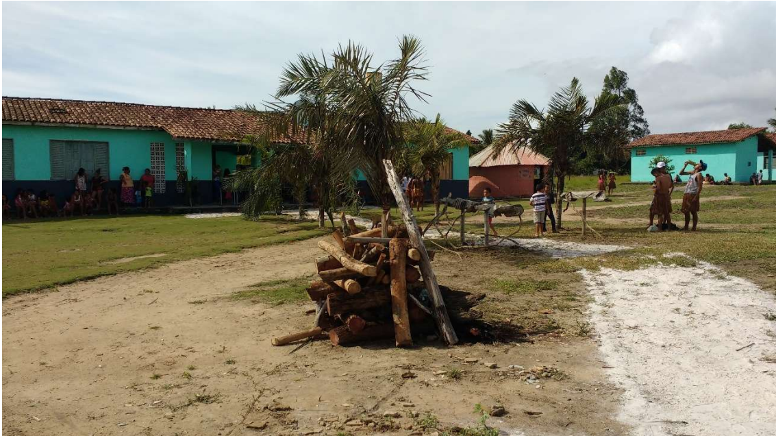
Figura 10. Foto: Tamikuã pataxó, Escola Estadual Indígena Aksã Pataxó, Aldeia Craveiro.

desenvolvimento dos trabalhos, sendo necessário utilizar como salas de aula o espaço que pertence ao posto de saúde local. Recentemente, foi construído um pequeno kijeme (oca) para servir de sala de aula, melhorando assim o espaço físico.