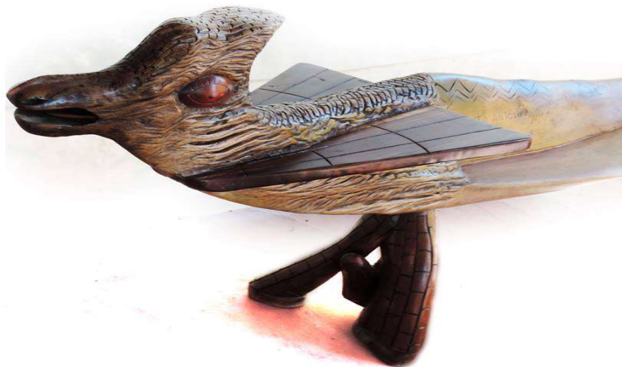
FIGURA:44 Madeira: pequi