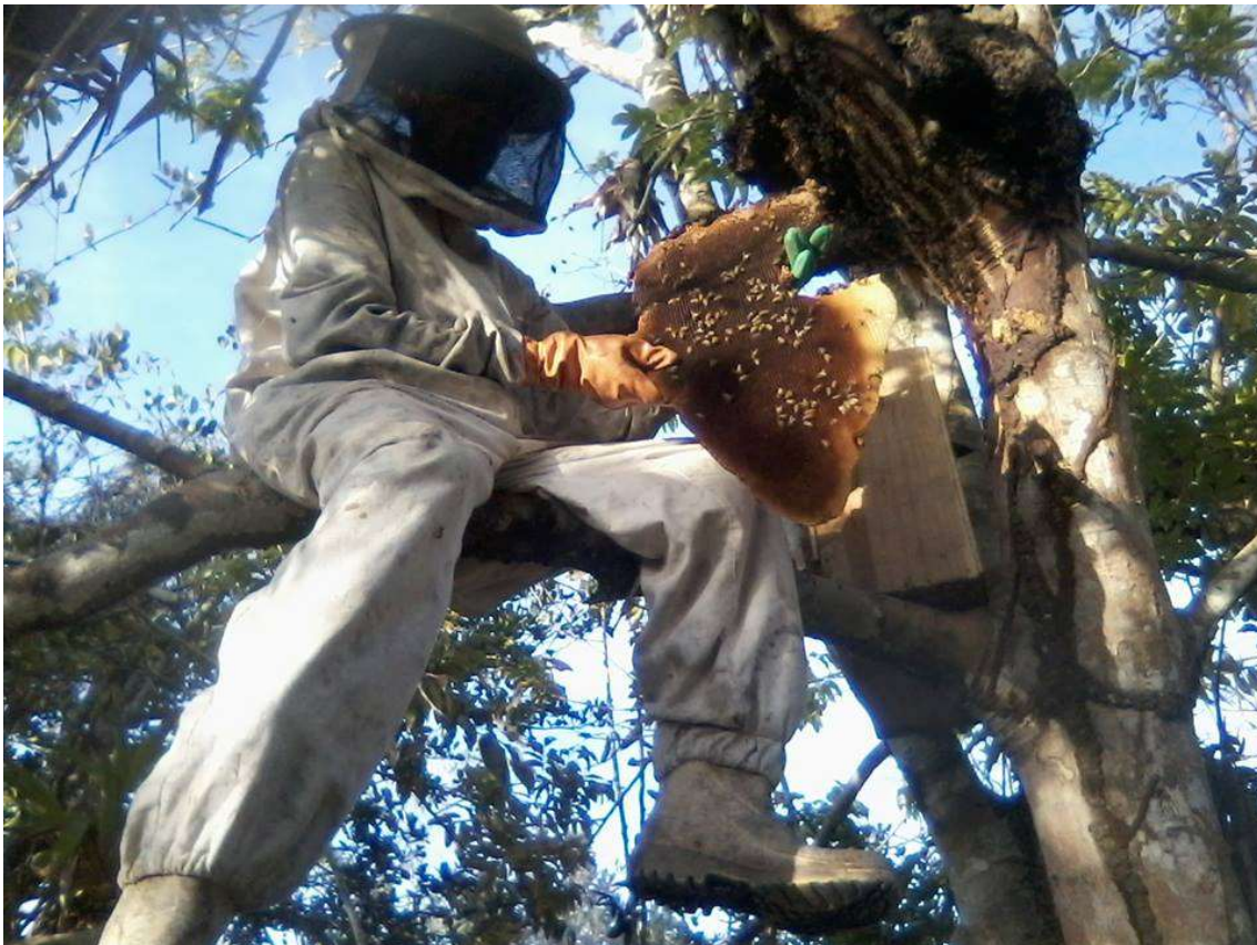
Figura 19 Captura em árvore em via pública.

É importante lembrar que apesar de serem capturadas, as abelhas ficam livres, podendo ir embora para a natureza quando quiserem. Geralmente a captura é feita em vias públicas, residências e pousadas no entorno da reserva. Por estarem localizados em regiões próximas da mata, é comum o surgimento de enxames. Essas capturas também