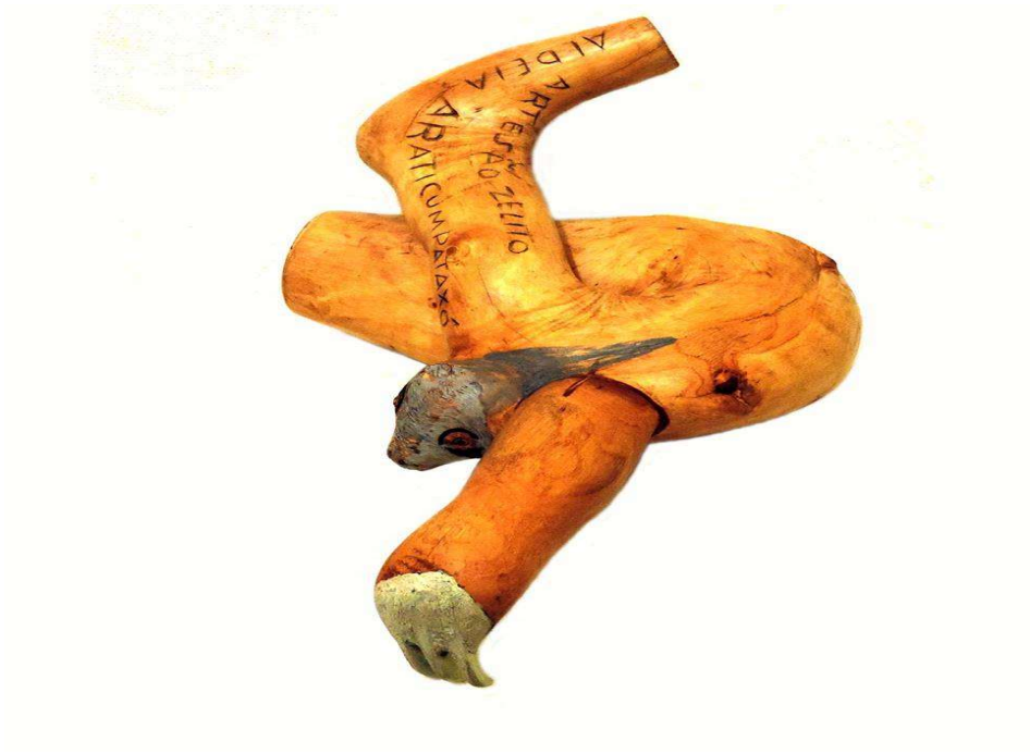
Figura 56: Preguiça (gnewi) feita com raiz de murici.