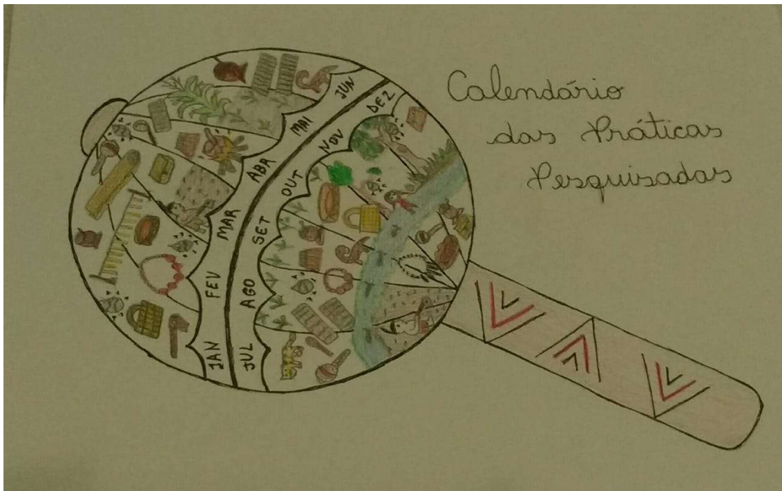
Figura 67 calendário voltado para as atividades pesquisadas.