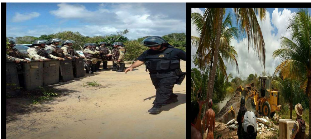
Figura 04 Destruição do posto de saúde da reserva Aratikum.

No dia 13 de outubro, reunidos para o ritual da manhã em nosso centro cultural, avistamos uma triste cena, a chegada da Polícia Federal, que vieram com uma triste missão derrubar as nossas casas e tirar o nosso pedaço de chão.