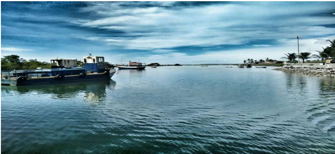
Figura 01: Porto de Cabralia, Rio João de Tiba, (Travessia Cabralia Santo André)