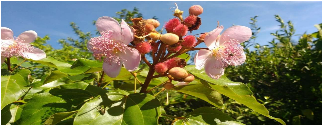
Figura 13 Florada do urucum.

Mandioca (mukunã) principal fonte de alimentação do nosso povo, com a qual produzimos kuyuna (farinha) beijú (makaiába) espécie de bolo da culinária indígena, kawin (bebida tradicional do nosso povo), paçoca, podendo também ser consumida cozida, frita, etc. Bananeira, feijão (kumãdá) de várias espécies como: andu (nahão), feijão de corda (kavãg). Além de abacaxi, pimenta do reino, e muitos outros.