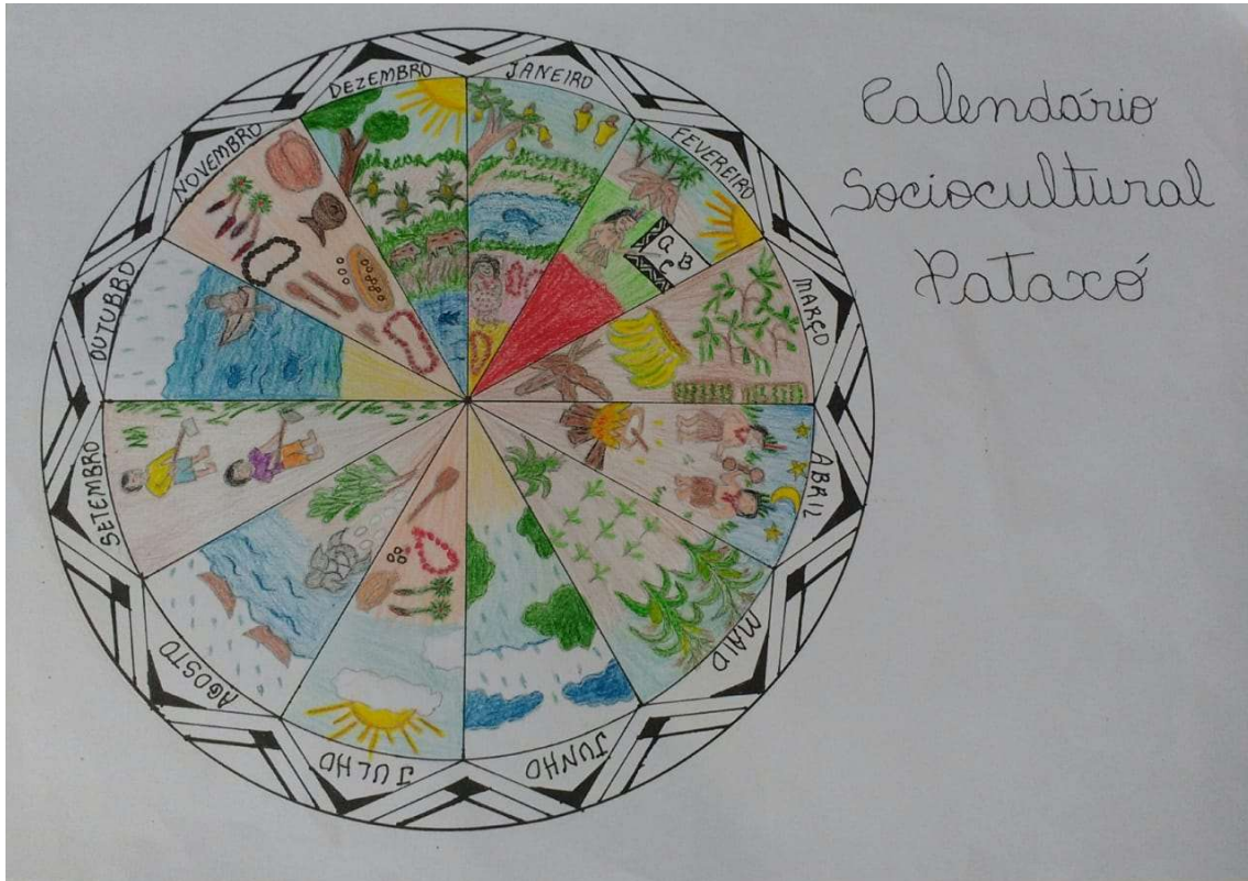
Figura 66 Calendário Sociocultural Pataxó.