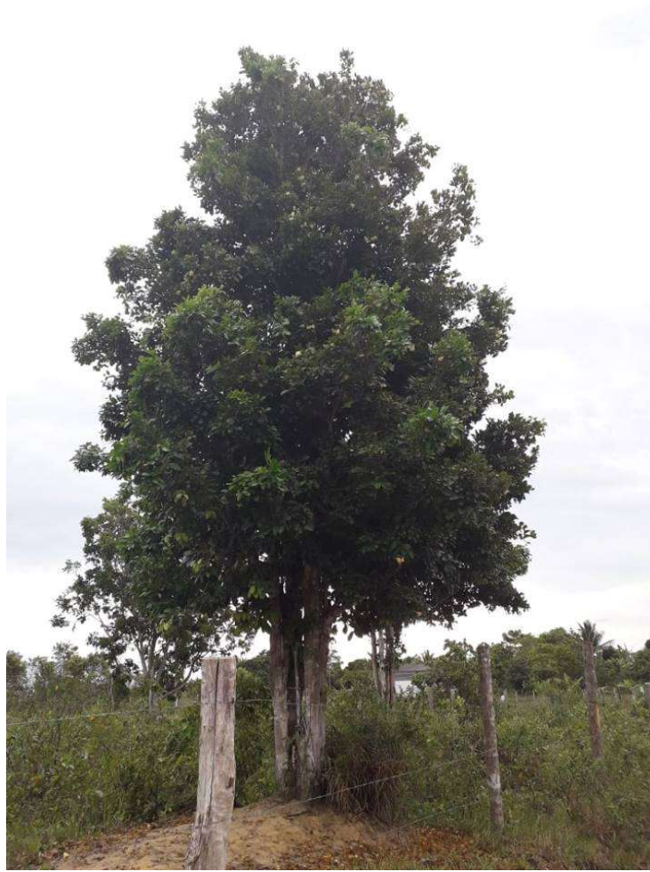
Figura 62. Foto: Tamikuã Pataxó, árvore de biriba ainda jovem