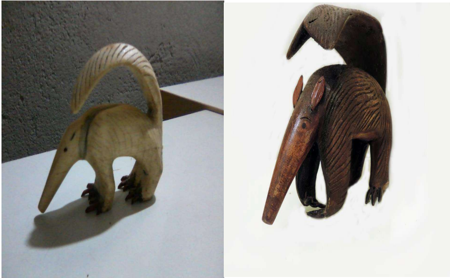
FIGURA 45 e 46: Tamanduá bandeira. (mõdahã)

O banco (assento) das figuras 2 e 3 foi feito com parte de uma canoa que se encontrava descartada às margens do rio João de Tiba em Santo André no município de Santa Cruz de Cabrália, Ba.