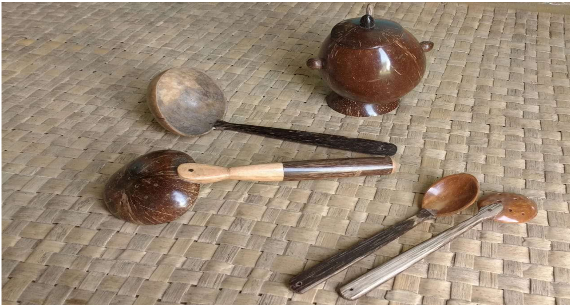
Figura 22 utensílios feitos com coco.

Na nossa cultura, fazemos uso de diversas palmeiras na confecção de nossos artesanatos, entre elas figuram o tucum, a piaçava, o pati, dentre outros. No entanto, o coco da praia ( Cocos nucifera ) é uma das palmeiras mais comuns na região. Dela se aproveita praticamente tudo, desde a sua água, que além de muito saborosa é um excelente hidratante para o corpo, até sua polpa que serve de alimento, além de ser usada na fabricação de doces, manteiga e óleos. Mas a nossa matéria prima vinda dessa palmeira é justamente o que se costuma jogar fora, a sua casca. Elas são utilizadas na confecção do nosso artesanato. Utensílios de cozinha, conchas, colheres, enfeites de mesa, porta moedas, brincos, colares, etc. São feitos da casca interna do coco seco que não teria mais serventia para o consumo. São feitos também objetos de decoração com a casca externa. Esse tipo de artesanato é muito comum em várias aldeias, porém esta pesquisa foi desenvolvida na Aldeia Craveiro com a artesã Evanilda de Brito Bandeira, (Aponãhi Pataxó), a qual trabalha com vários tipos de artesanato. Para a fabricação desse artesanato há a necessidade de algumas ferramentas, como serra, que pode ser manual, lixa, cola, raspador (espécie de faca) e o principal, o motor, que, no caso da Aponahi, (feliz)é utilizado um velho motor de farinha adaptado por ela mesma. Após retirar a casca externa do coco, Aponahi utiliza a serra para abri-lo de forma que se aproveitem ambas as partes.