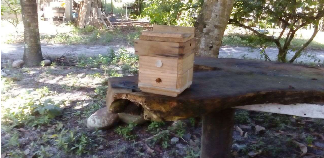
Figura 17 Foto Tamikuã Pataxó apiário com um enxame de jataí.

O casal Piocomel e Antônia viram que poderia ser um negócio lucrativo e começou a investir aos poucos, com cursos de apicultura e comprando roupas apropriadas, utensílios para tratar o mel, (centrifugador), também aprendeu a devolver alguns desses utensílios com suas habilidades de carpinteiro, além de produzir o mel. Mais tarde, já em 2016, com o aumento do número de apiários, o casal passou também a fazer extração do própolis, já que deve ser separado o apiário de que se extrai o própolis do de que se extrai o mel, pois as duas atividades no mesmo apiário põem em risco a existência do enxame. Por esse motivo passaram a capturar mais abelhas com o objetivo de produzirem mais mel. Em 2017, passaram a capturar colmeias de abelhas jataí, (sem ferrão). A espécie dessa abelha costuma construir suas casas no chão, e produz um mel mais raro em menor quantidade, mais concentrado, por isso, mais caro.