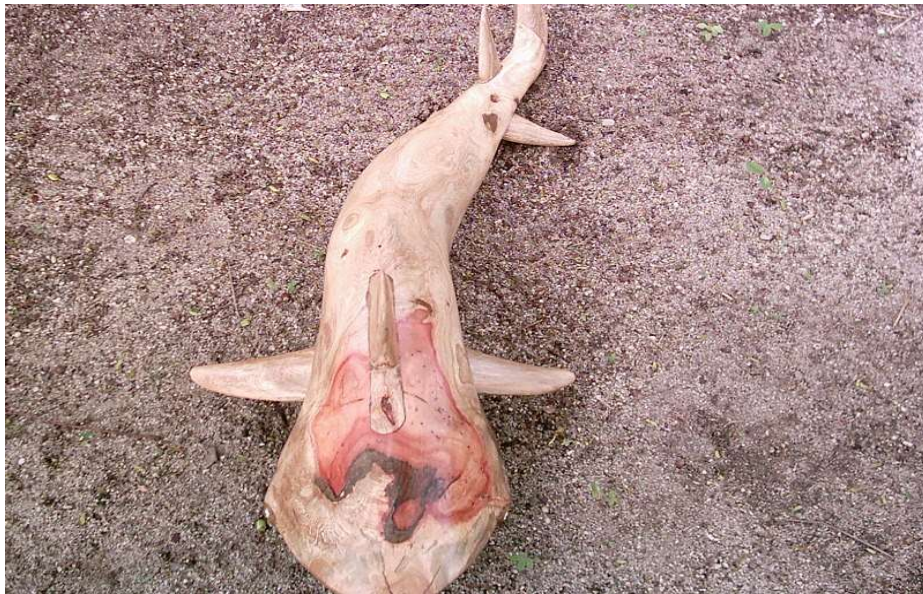
FIGURA 49: Tubarão (mukusuy) feito de raiz de Angelim-morcego.