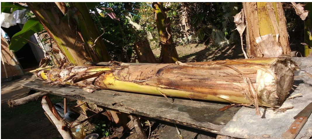
Figura 25 Tronco de bananeira recolhido pela artesã para ser transformado em matéria prima de seu trabalho.

A bananeira é uma das plantas mais encontradas nas aldeias, presente em praticamente todos os quintais. O maior motivo do seu cultivo é o seu fruto, que contém um auto teor de potássio e de outras vitaminas. Por isso, é uma das frutas mais consumidas, especialmente por ela se adaptar facilmente a vários tipos de solo. O que muita gente não sabe é que seu tronco possui fibras que podem ser utilizadas para a confecção de bolsas, chapéus, cestos, utensílios de cozinha, etc. Fabricados a partir da fibra de bananeira e costuradas com linha de tucum. A atividade desenvolvida pela artesã Evanilda de Brito Bandeira, (Aponãhi Pataxó), na Aldeia Indígena Pataxó Craveiro, situada no Território Barra Velha, município do Prado, BA, sua matéria prima principal as fibras dos troncos de bananeira, as quais são retiradas de seu próprio plantio. Ela ainda utiliza sementes, varas de uruba, (planta nativa da região), tintas naturais, (de urucum, jenipapo...), além da linha extraída manualmente das folhas de tucum, (palmeira nativa da região). Na colheita da banana, que se dá na retirada dos cachos, a planta é cortada para deixar espaço para as mudas que estão crescendo, os troncos cortados geralmente são deixados no solo para se decompor. A artesã, entretanto, recolhe esses troncos e os transforma na principal matéria-prima de seus trabalhos. Abaixo, é descrito o processo de preparo das fibras de bananeira para a fabricação o dos artesanatos:.