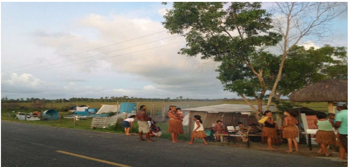
Figura 07 Acampamento improvisado as margens da BA-001