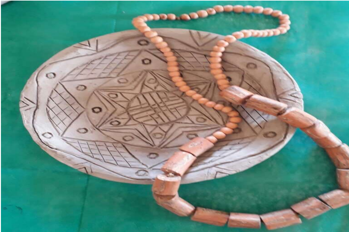
Figura 40(foto Tamikuã Pataxó) prato e colar de argila.

comecei a desenvolvê-la aos poucos em minhas aulas de arte e de cultura indígena, primeiro na Reserva Aratikum e mais tarde na Aldeia Craveiro, onde moro atualmente.