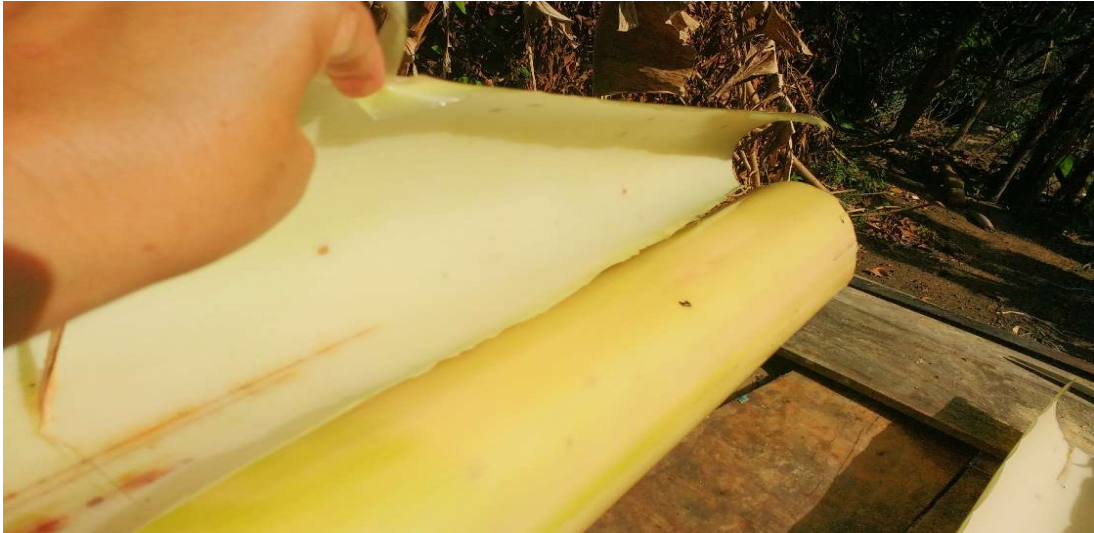
figura 26 Limpa-se o tronco, retirando as primeiras capas, até aparecer a parte lisa.