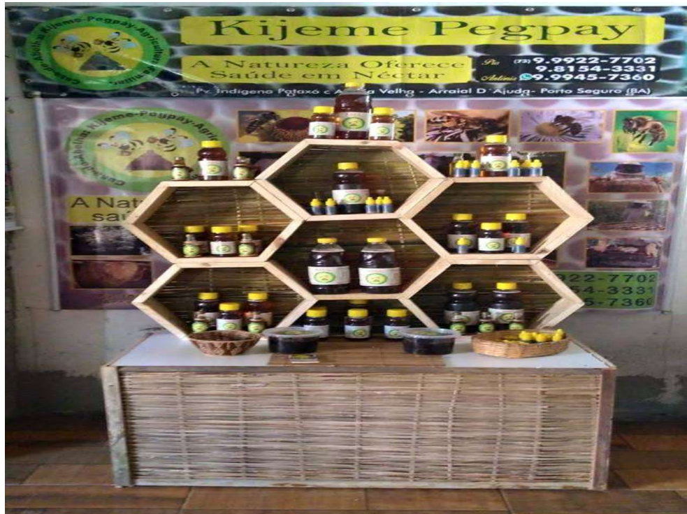
Figura 21 Mostruário de vendas.

Atualmente o casal, além de aumentar sua renda com o trabalho de captura, também comercializa o mel, o própolis e o favo em embalagens de vários tamanhos.